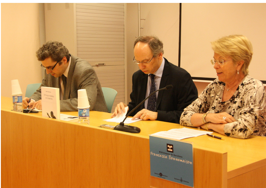
Presentació del llibre 'El Príncep mediàtic en el laberinto' organitzada per l'Associació d'Amics, que va tenir lloc el passat 11 de març a la biblioteca Francesca Bonnemaïson.

A Espanya només ho fa un diari, que és El Mundo. El senyor Pedro J. Ramírez fa una editorial i diu: 'Aquest diari donarà suport a...'. Això significa que en aquell diari les notícies i la informació seran sectàries perquè ha fet això? No. Està dient que un cop