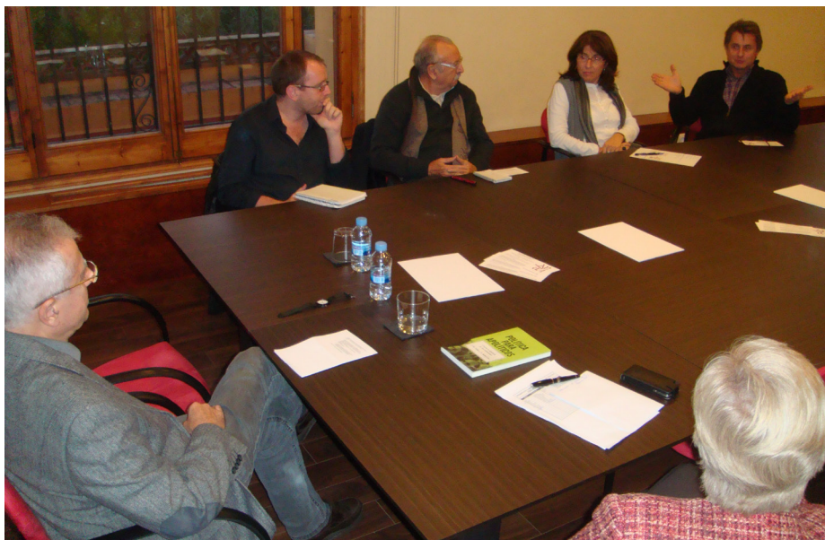
Presentació del llibre 'Política para apolíticos' a la Torre Vila-Puig, seu de l'Associació d'Amics de la UAB

vendre el seu producte més car i no clarament millor.